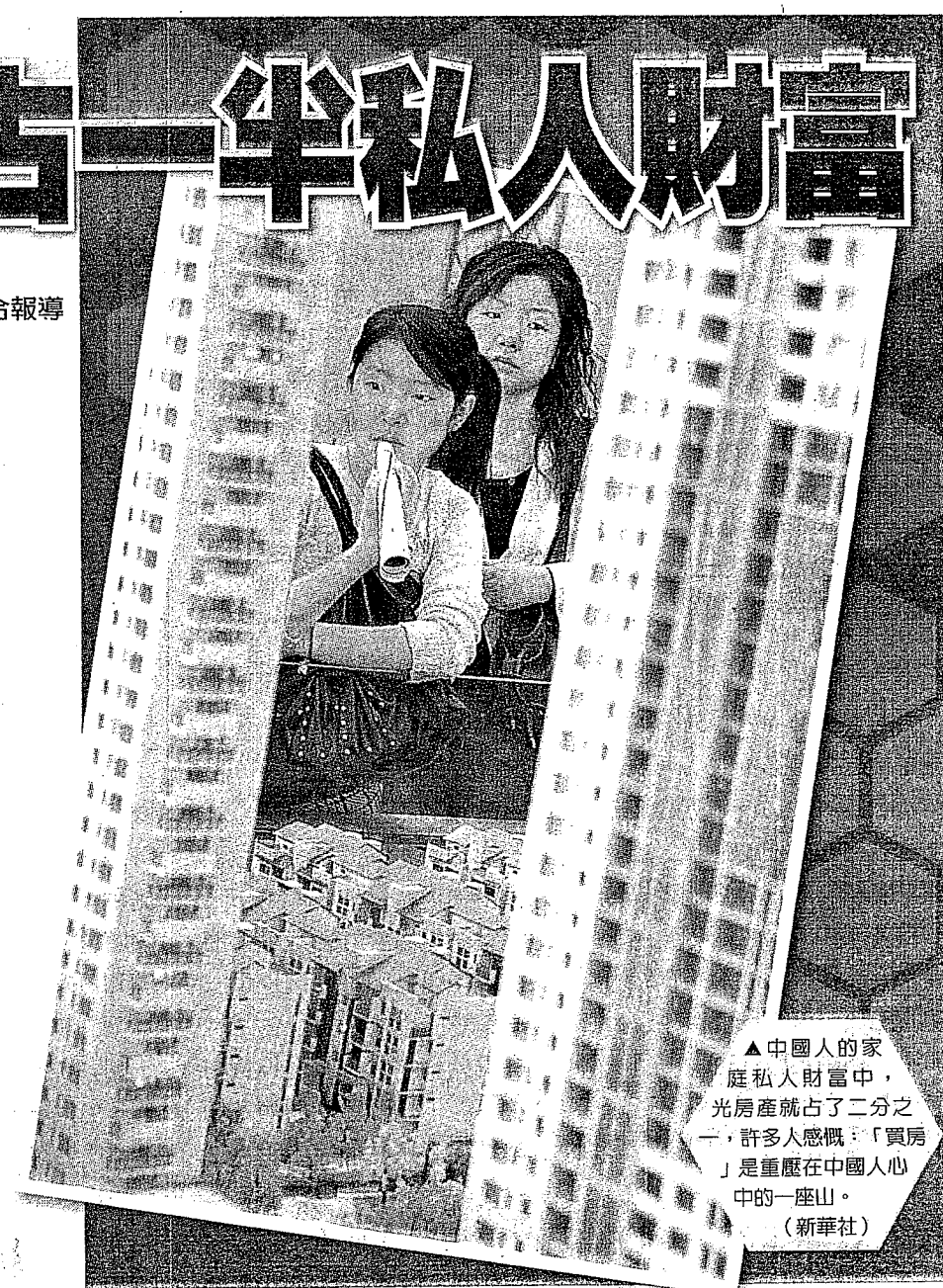
▲中國人的家庭私人財富中，光房產就占了二分之一，許多人感慨：「買房」是重壓在中國人心中的一座山。

綜上，中國人的家庭私人財富總額大約為80兆左右，其中40兆為住房，25兆為存款，7兆為股票，剩下的一