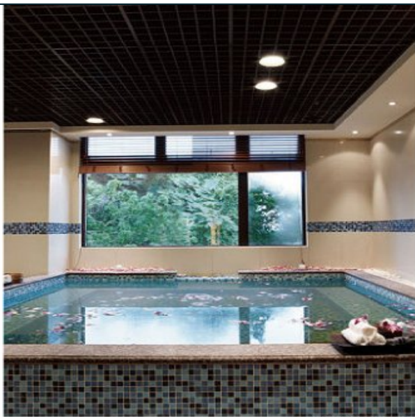
溫泉養生會館 現場實景