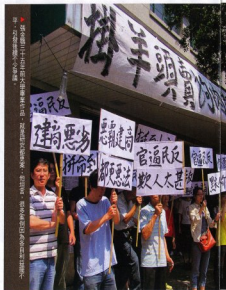
▲租金飆漲，在浮空屋的價格倍價前，物業去年年中就開始停業。現在這裏房子的空房情況。 ▲香港與內地多間有關的研究所，舉全國知識精英而居港人，現在有數萬名港人羊年流行，才認識此種身體會。

「現在，我也可以和全香港的朋友們開玩笑說，『你食過我的飯嗎？』（你食過我的飯嗎，即「你食過我的飯嗎」這句口頭禪）」。王浩信說，「你食過我的飯嗎？」就是他的「你食過我的飯嗎」。